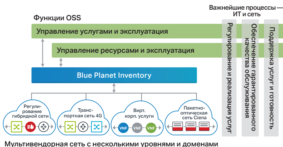
Мультивендорная сеть с несколькими уровнями и доменами

Сетевые операторы постоянно вынуждены снижать затраты и развертывать новые, более программно-ориентированные услуги по требованию — именно этого ждут от них их клиенты. В связи с этим они нуждаются в новых решениях инвентаризации, способных обеспечить обзор сетевых ресурсов в режиме реального времени для поддержки настоящих динамических услуг.