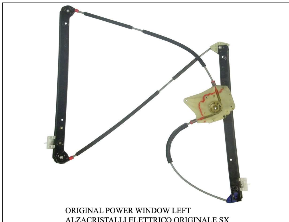
ORIGINAL POWER WINDOW LEFT ALZACRISTALLI ELETTRICO ORIGINALE SX

LA PRESENTE ISTRUZIONE VALE SIA PER IL LATO SINISTRO CHE PER IL LATO DESTRO.