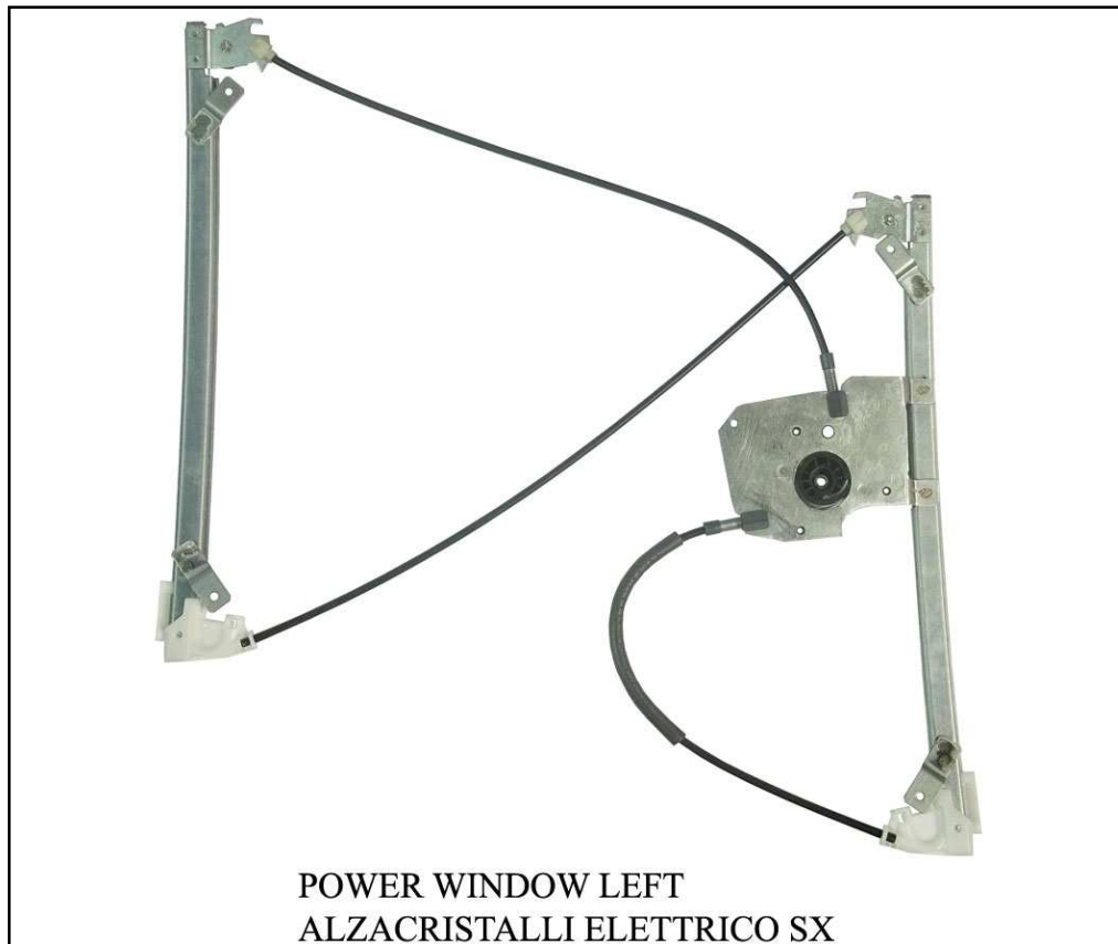
POWER WINDOW LEFT ALZACRISTALLI ELETTRICO SX

left door - portière gauche - linke tür - puerta lado izquierdo - porta esquerda - porta lato sinistro