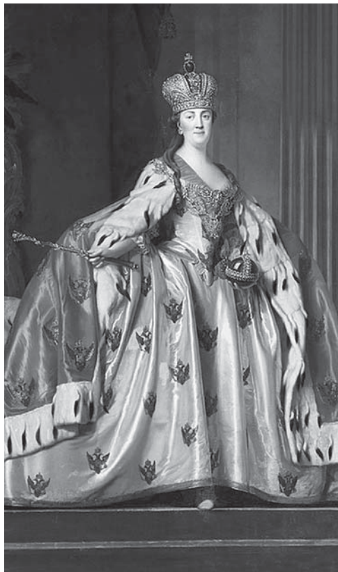
Императрица Екатерина II