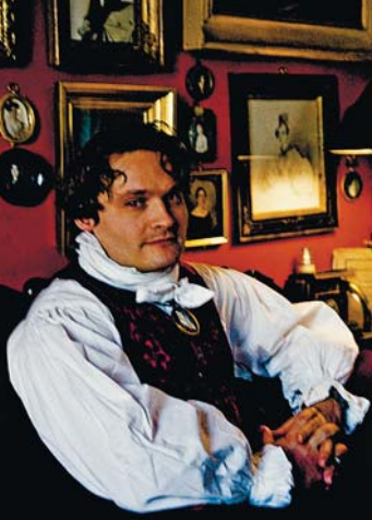
Фото: Кристиан Дубуа-Рубино