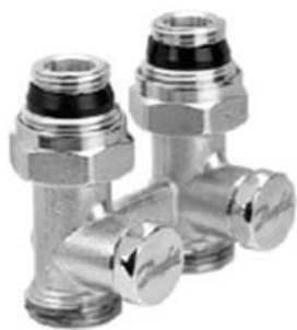
RLV-KS прямой с присоединением к отопительному прибору G ½ и G ¾