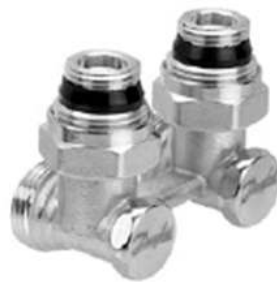
RLV-KS угловой с присоединением к отопительному прибору G ½ и G ¾