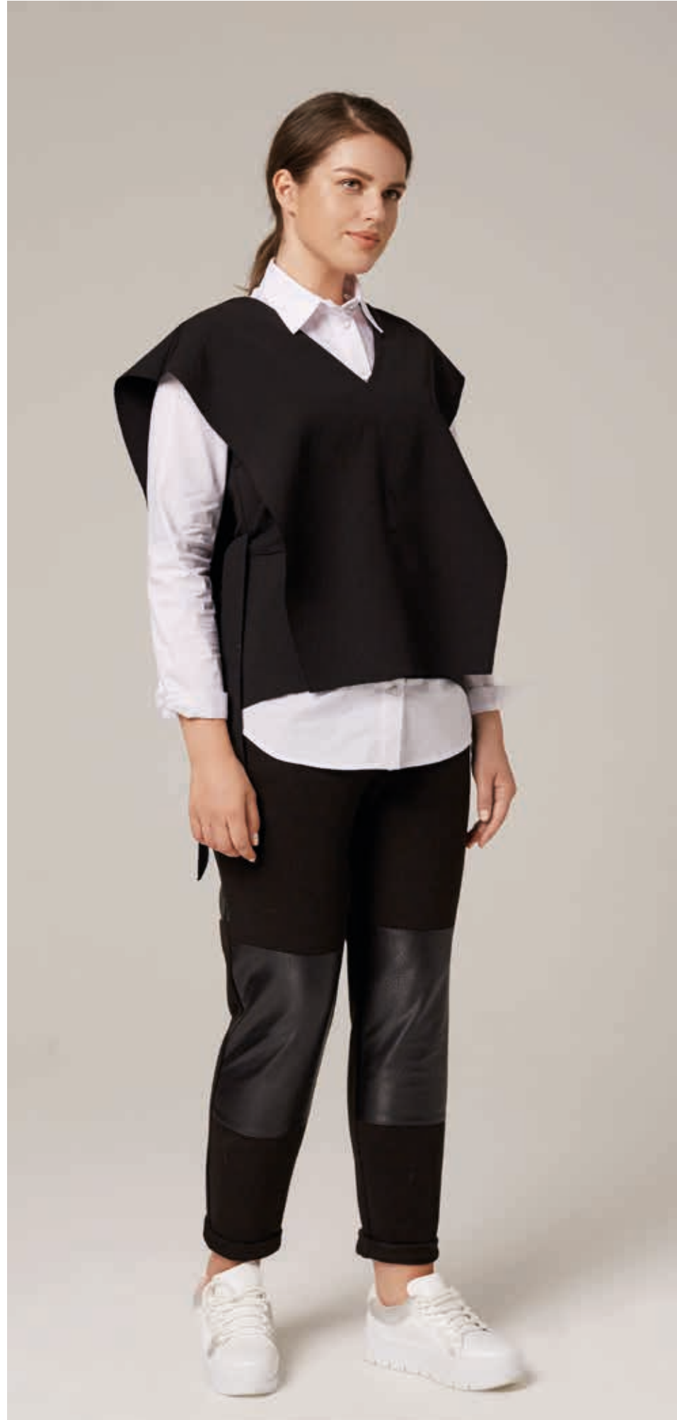
ЖИЛЕТ АРТ. 18-933

СОСТАВ: 50% ТЕНСЕЛ, 5% РАЙОН, 45% ПОЛИЭСТЕР ЦВЕТ: ЧЕРНЫЙ РАЗМЕРНЫЙ РЯД: М, L, XL