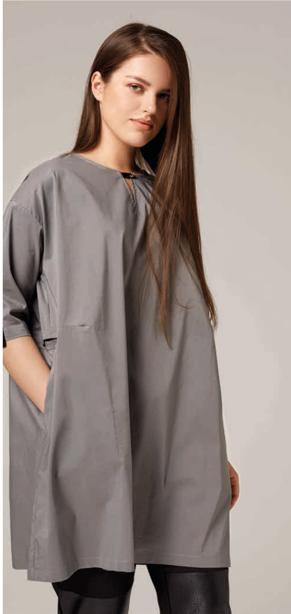
ТУНИКА АРТ. 18-715

СОСТАВ: 100% ХЛОПОК ЦВЕТ: СЕРЫЙ РАЗМЕРНЫЙ РЯД: М, L, XL