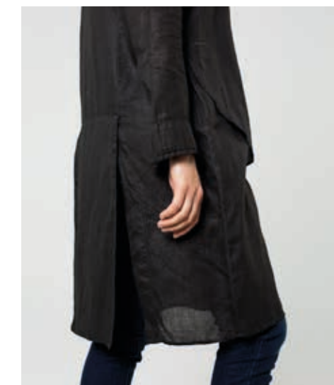
РУБАШКА АРТ. 16-001

СОСТАВ: 100% КРАПИВА РАМИ (ВОСК) ЦВЕТ: ЧЕРНЫЙ РАЗМЕРНЫЙ РЯД: М, L, XL, 2XL, 3XL