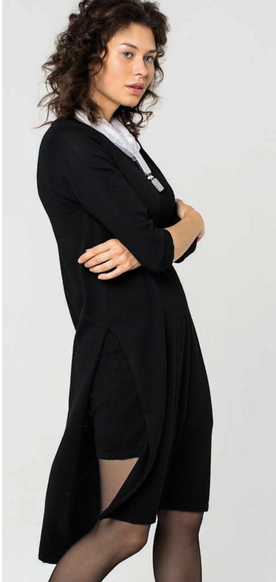
ТУНИКА АРТ. 18-022

СОСТАВ: 20% ЛЕН, 10% КОНОПЛЯ, 10% ШЕРСТЬ, 30% АКРИЛ, 30% ВИСКОЗА ЦВЕТ: ЧЕРНЫЙ РАЗМЕРНЫЙ РЯД: М, L, XL