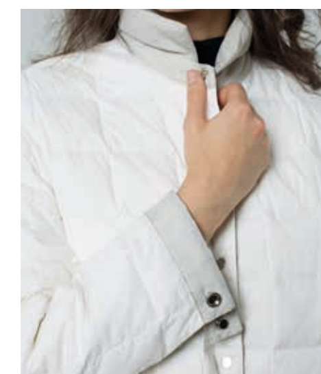
ПАЛЬТО АРТ. 18-017

СОСТАВ: 90% ПУХ, 10% ПЕРО ЦВЕТ: БЕЛЫЙ РАЗМЕРНЫЙ РЯД: M, L, XL