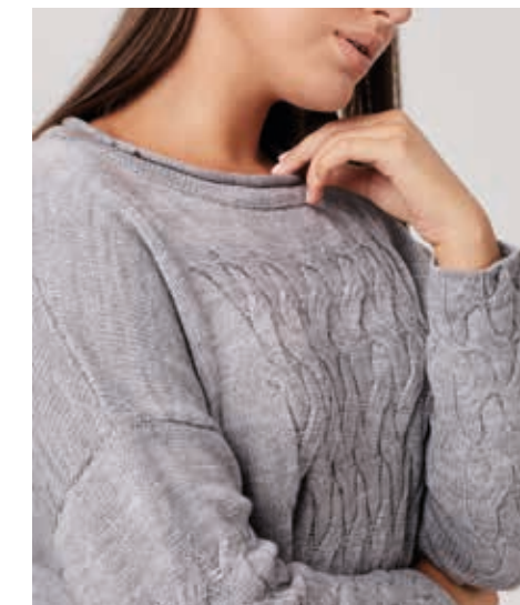
ОСЕНЬ-ЗИМА 2016 ДЖЕМПЕР АРТ. 18-967

СОСТАВ: 50% АНГОРА, 23% ХЛОПОК, 27% ВИСКОЗА ЦВЕТ: СЕРЫЙ, БЕЖЕВЫЙ РАЗМЕРНЫЙ РЯД: М, L, XL