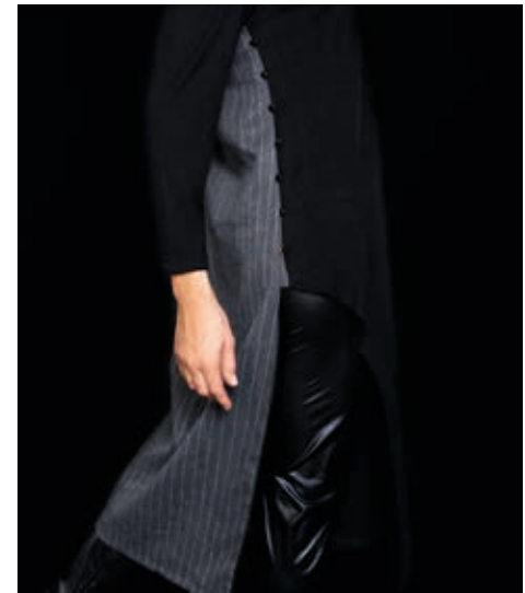
ТУНИКА АРТ. 18-010

ЦВЕТ: ЧЕРНЫЙ+СЕРЫЙ ПОЛОСА РАЗМЕРНЫЙ РЯД: М, L, XL