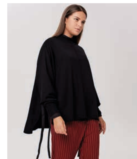
ДЖЕМПЕР АРТ. 18-936

СОСТАВ: 50% ШЕРСТЬ КРОЛИКА, 23% ХЛОПОК, 27% ВИСКОЗА ЦВЕТ: СЕРЫЙ, ЧЕРНЫЙ РАЗМЕРНЫЙ РЯД: F