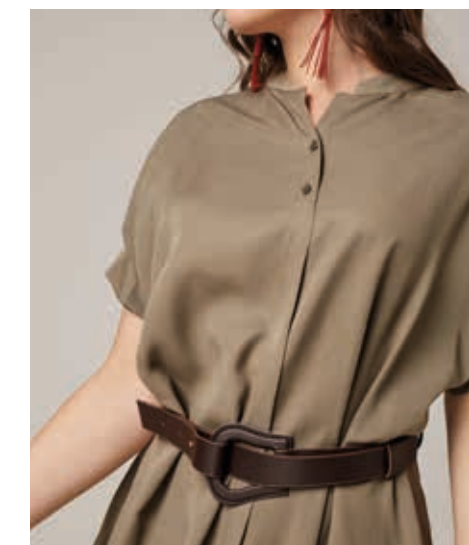
ПЛАТЬЕ АРТ. 19-004

СОСТАВ: 27% ЛЕН, 73% РАЙОН ЦВЕТ: ХАКИ РАЗМЕРНЫЙ РЯД: M, L, XL, 2XL