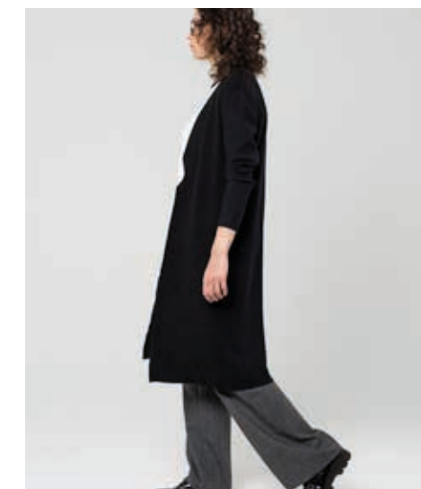
КАРДИГАН АРТ. 89013

СОСТАВ: 70% АНГОРА, 20% ВИСКОЗА ЦВЕТ: ЧЕРНЫЙ РАЗМЕРНЫЙ РЯД: М, L, XL