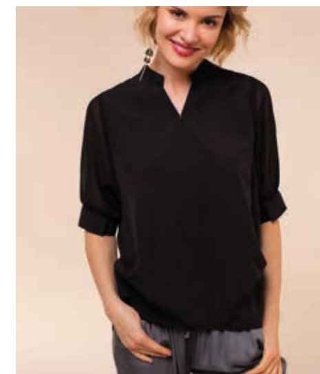
БЛУЗА АРТ. 18-808

СОСТАВ: 70% ШЕЛК, 30% ВИСКОЗА ЦВЕТ: ЧЕРНЫЙ, БЕЛЫЙ РАЗМЕРНЫЙ РЯД: М, L, XL, 2XL