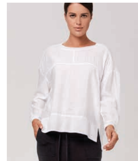
БЛУЗА АРТ. 17-526

СОСТАВ: 30% ЛЕН, 50% ПЭ, 20% ХЛОПОК ЦВЕТ: ЧЕРНЫЙ, БЕЛЫЙ, СЕРЫЙ РАЗМЕРНЫЙ РЯД: M, L, XL, 2XL