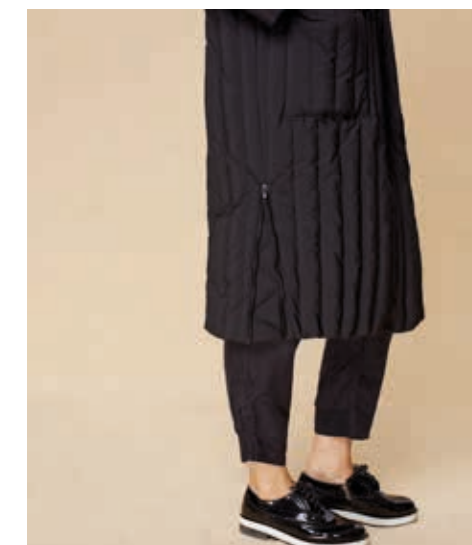
ПАЛЬТО АРТ. 18-994

СОСТАВ: 90% ПУХ, 10% ПЕРО ЦВЕТ: ЧЕРНЫЙ РАЗМЕРНЫЙ РЯД: М, L, XL, 2XL