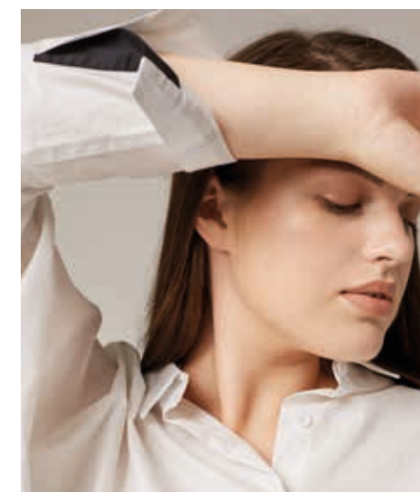
БЛУЗА АРТ. 18-717

СОСТАВ: 100% ХЛОПОК ЦВЕТ: БЕЛЫЙ РАЗМЕРНЫЙ РЯД: М, L, XL, 2XL