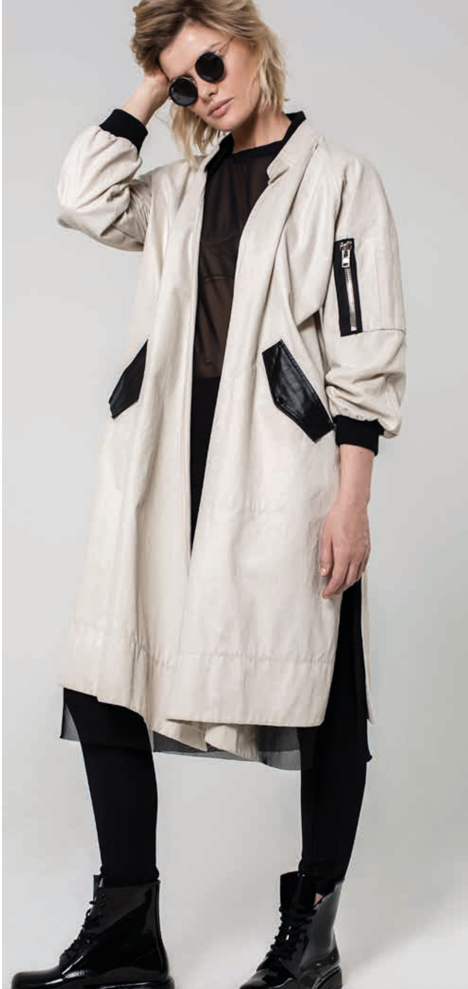
ПЛАЩ АРТ. 18-014

СОСТАВ: 100% ХЛОПОК ЦВЕТ: БЕЛЫЙ РАЗМЕРНЫЙ РЯД: М, L, XL, 2XL