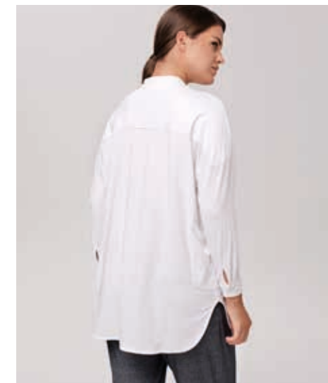
БЛУЗА АРТ. 17-527

СОСТАВ: 100% ХЛОПОК ЦВЕТ: БЕЛЫЙ, ЧЕРНЫЙ РАЗМЕРНЫЙ РЯД: М, L, XL, 2XL