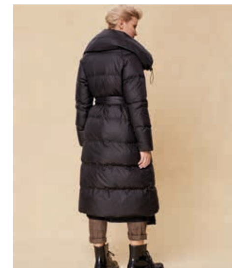
ПАЛЬТО АРТ. 18-019

СОСТАВ: 90% ПУХ, 10% ПЕРО ЦВЕТ: ЧЕРНЫЙ, БОРДОВЫЙ РАЗМЕРНЫЙ РЯД: S, M, L