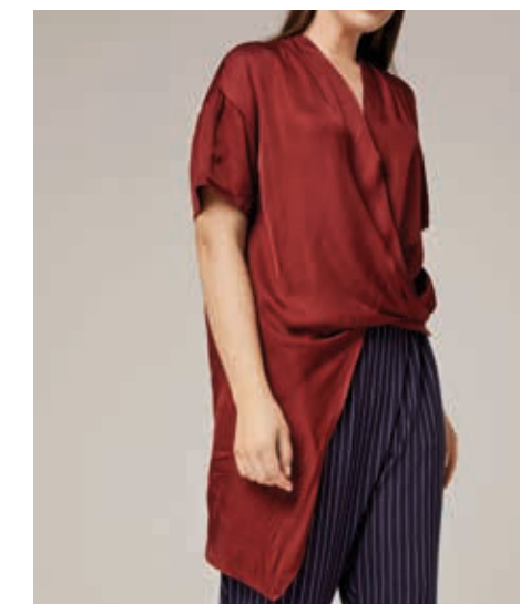
БЛУЗА АРТ. 18-717 К

СОСТАВ: 100% ШЕЛК ЦВЕТ: БЕЛЫЙ, БОРДОВЫЙ РАЗМЕРНЫЙ РЯД: М, L, XL, 2XL