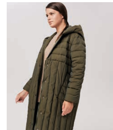
ПАЛЬТО АРТ. 18-950

СОСТАВ: 90% ПУХ, 10% ПЕРО ЦВЕТ: ЗЕЛЕНЫЙ РАЗМЕРНЫЙ РЯД: S, M, L, XL, 2XL