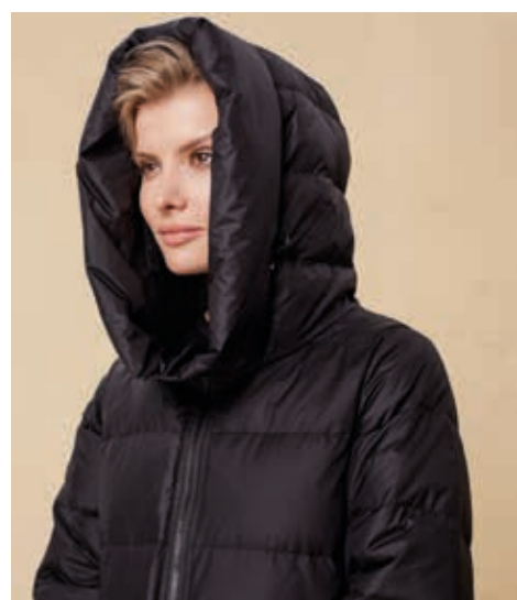
ПАЛЬТО АРТ. 18-018

СОСТАВ: 90% ПУХ, 10% ПЕРО ЦВЕТ: ЧЕРНЫЙ, СЕРЫЙ РАЗМЕРНЫЙ РЯД: М, L, XL, 2XL