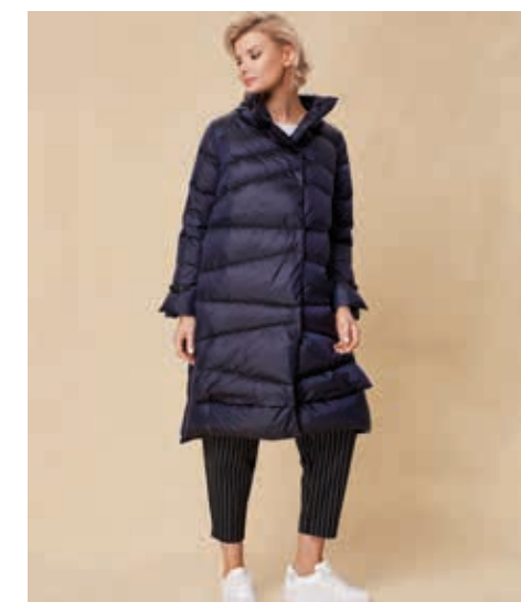
ПАЛЬТО АРТ. 1601

СОСТАВ: 90% ПУХ, 10% ПЕРО ЦВЕТ: ЧЕРНЫЙ, СЕРЫЙ МЕТАЛЛИК, СИНИЙ РАЗМЕРНЫЙ РЯД: S, M, L