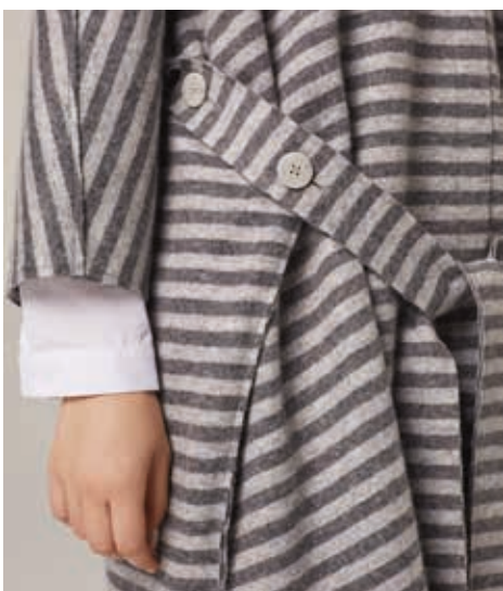
ПАЛЬТО ПОНЧО АРТ. 18-977

СОСТАВ: 90% КАШЕМИР, 10% ХЛОПОК ЦВЕТ: ПОЛОСА РАЗМЕРНЫЙ РЯД: F