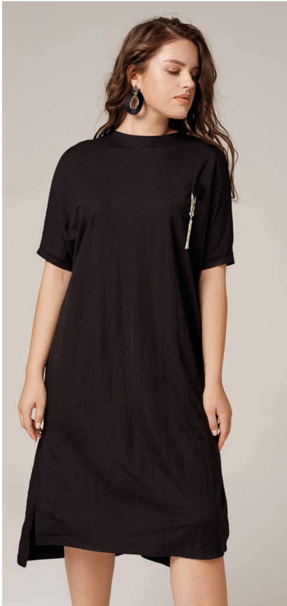
ПЛАТЬЕ АРТ. 18-705

СОСТАВ: 36% БАМБУК, 36% ТЕНСЕЛ, 28% ХЛОПОК ЦВЕТ: ЧЕРНЫЙ, ХАКИ РАЗМЕРНЫЙ РЯД: М, L, XL