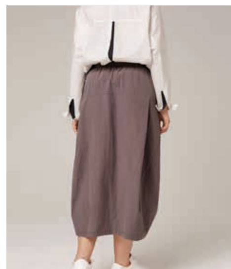
ЮБКА АРТ. 939

СОСТАВ: 80% ШЕРСТЬ, 20% ПЭ ЦВЕТ: СЕРЫЙ, КОРИЧНЕВЫЙ РАЗМЕРНЫЙ РЯД: М, L, XL, 2XL