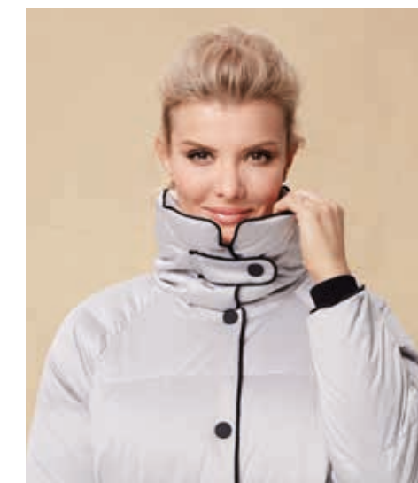
ПАЛЬТО АРТ. 18-992

СОСТАВ: 90% ПУХ, 10% ПЕРО ЦВЕТ: БЕЖЕВЫЙ, СЕРЫЙ РАЗМЕРНЫЙ РЯД: М, L, XL, 2XL