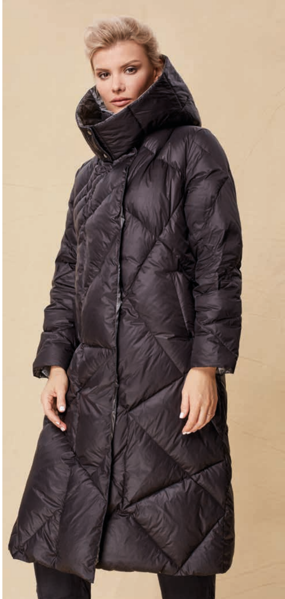
ПАЛЬТО АРТ. 1605

СОСТАВ: 90% ПУХ, 10% ПЕРО ЦВЕТ: ЧЕРНЫЙ, СИНИЙ МЕТАЛЛИК РАЗМЕРНЫЙ РЯД: S, M, L, XL, 2XL