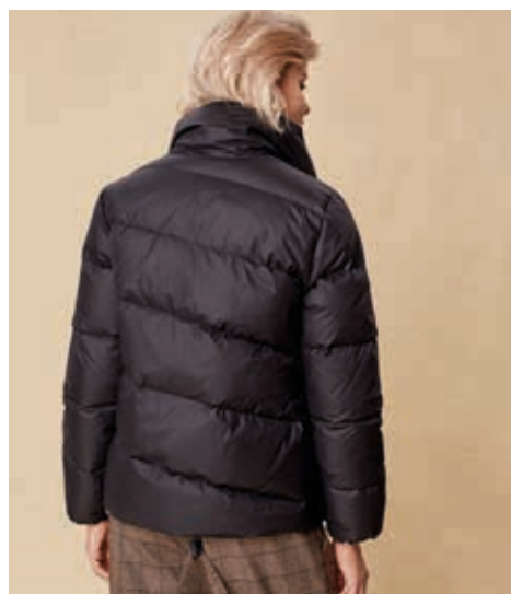
КУРТКА АРТ. 18-956

СОСТАВ: 90% ПУХ, 10% ПЕРО ЦВЕТ: ОЛИВА, ЧЕРНЫЙ, СЕРЫЙ РАЗМЕРНЫЙ РЯД: S, M, L