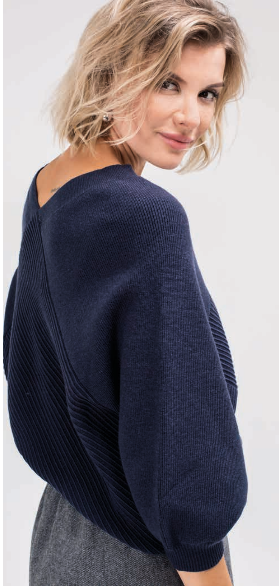
ОСЕНЬ-ЗИМА 2018 ДЖЕМПЕР АРТ. 89002

СОСТАВ: 20% ЛЕН, 10% КОНОПЛЯ, 10% ШЕРСТЬ, 30% АКРИЛ, 30% ВИСКОЗА ЦВЕТ: СИНИЙ РАЗМЕРНЫЙ РЯД: М, L, XL