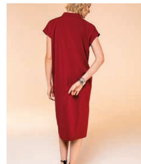
ПЛАТЬЕ АРТ. 17-037

СОСТАВ: 95% ХЛОПОК, 5% ЭЛАСТАН ЦВЕТ: ЧЕРНЫЙ, БОРДОВЫЙ РАЗМЕРНЫЙ РЯД: М, L, XL, 2XL