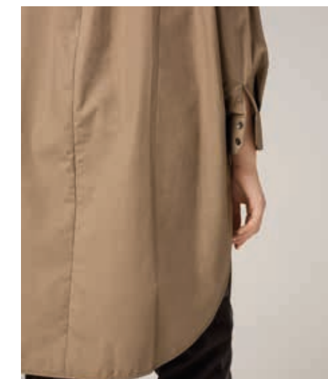
РУБАШКА АРТ. 18-707

СОСТАВ: 100% ХЛОПОК ЦВЕТ: СМОРОДИНА ЧЕРНАЯ, БЕЖЕВЫЙ РАЗМЕРНЫЙ РЯД: М, L, XL