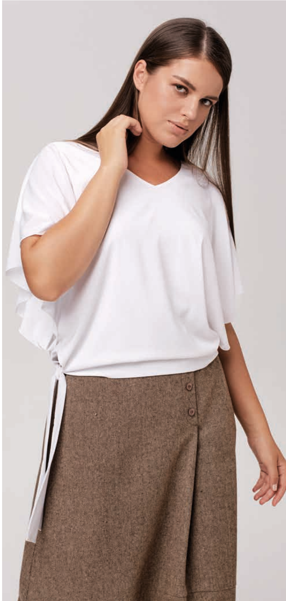
БЛУЗА АРТ. 18-723

СОСТАВ: 30% ШЕЛК, 70% ХЛОПОК ЦВЕТ: БЕЛЫЙ, ЧЕРНЫЙ, БЕЖЕВЫЙ РАЗМЕРНЫЙ РЯД: S, M, L, XL, 2XL