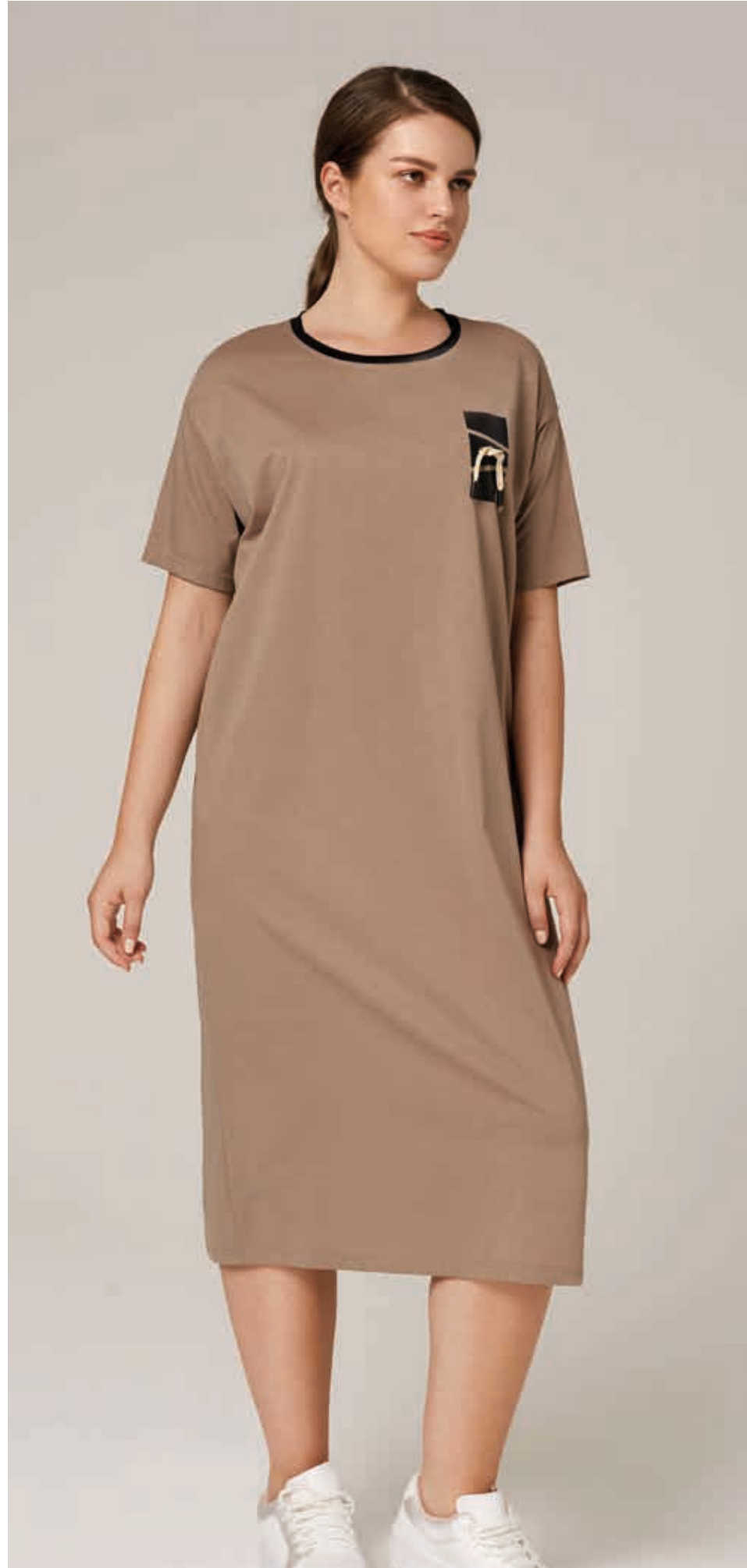
ОСЕНЬ-ЗИМА 2016 ПЛАТЬЕ АРТ. 18-718

СОСТАВ: 36% ТЕНСЕЛ, 50% ХЛОПОК, 10% БАМБУК, 4% СПАНДЕКС ЦВЕТ: БЕЖЕВЫЙ РАЗМЕРНЫЙ РЯД: М, L, XL, 2XL