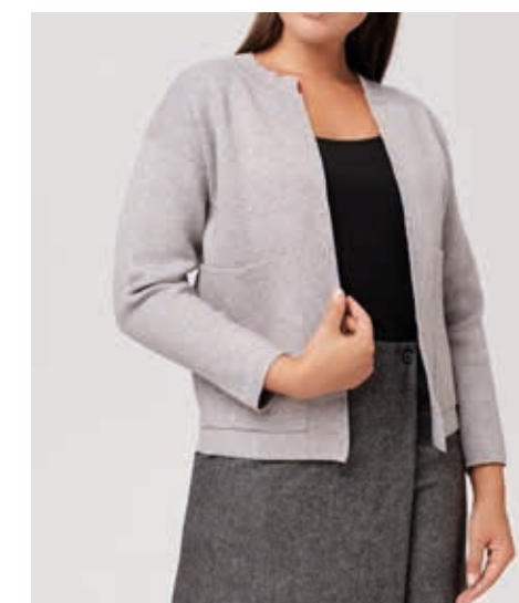
ЖАКЕТ АРТ. 17-004

СОСТАВ: 25% ШЕРСТЬ, 35% АКРИЛ, 40% ВИСКОЗА ЦВЕТ: СЕРЫЙ РАЗМЕРНЫЙ РЯД: М, L, XL, 2XL