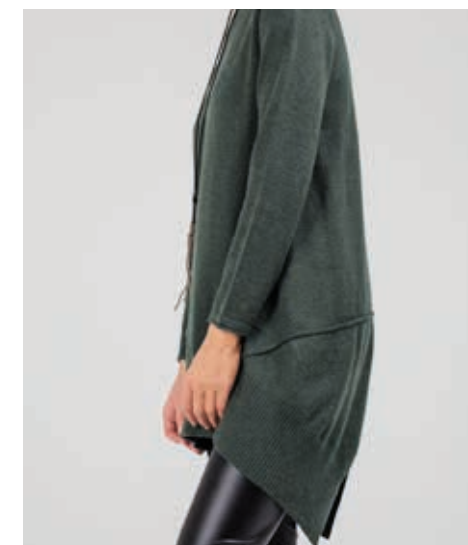
ОСЕНЬ-ЗИМА 2018 ТУНИКА АРТ. 89034

СОСТАВ: 20% ЛЕН, 10% КОНОПЛЯ, 10% ШЕРСТЬ, 30% АКРИЛ, 30% ВИСКОЗА ЦВЕТ: ИЗУМРУД РАЗМЕРНЫЙ РЯД: М, L, XL