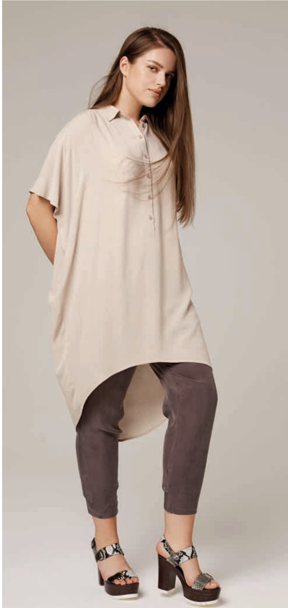
ТУНИКА АРТ. 19-005

СОСТАВ: 85% ТЕНСЕЛ, 15% ШЕЛК ЦВЕТ: БЕЖЕВЫЙ РАЗМЕРНЫЙ РЯД: F