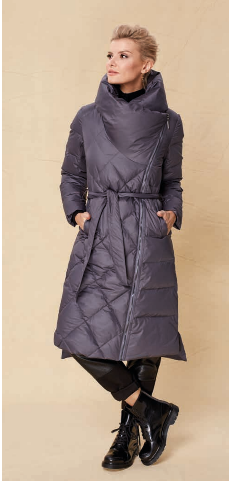
ПАЛЬТО АРТ. 18-996

СОСТАВ: 90% ПУХ, 10% ПЕРО ЦВЕТ: СЕРЫЙ РАЗМЕРНЫЙ РЯД: М, L, XL