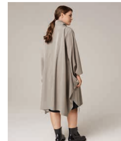
ОСЕНЬ-ЗИМА 2016 ПЛАЩ АРТ. 17-515

СОСТАВ: 85% ХЛОПОК, 15% ПЭ ЦВЕТ: ЧЕРНЫЙ, СЕРЫЙ РАЗМЕРНЫЙ РЯД: М, L, XL