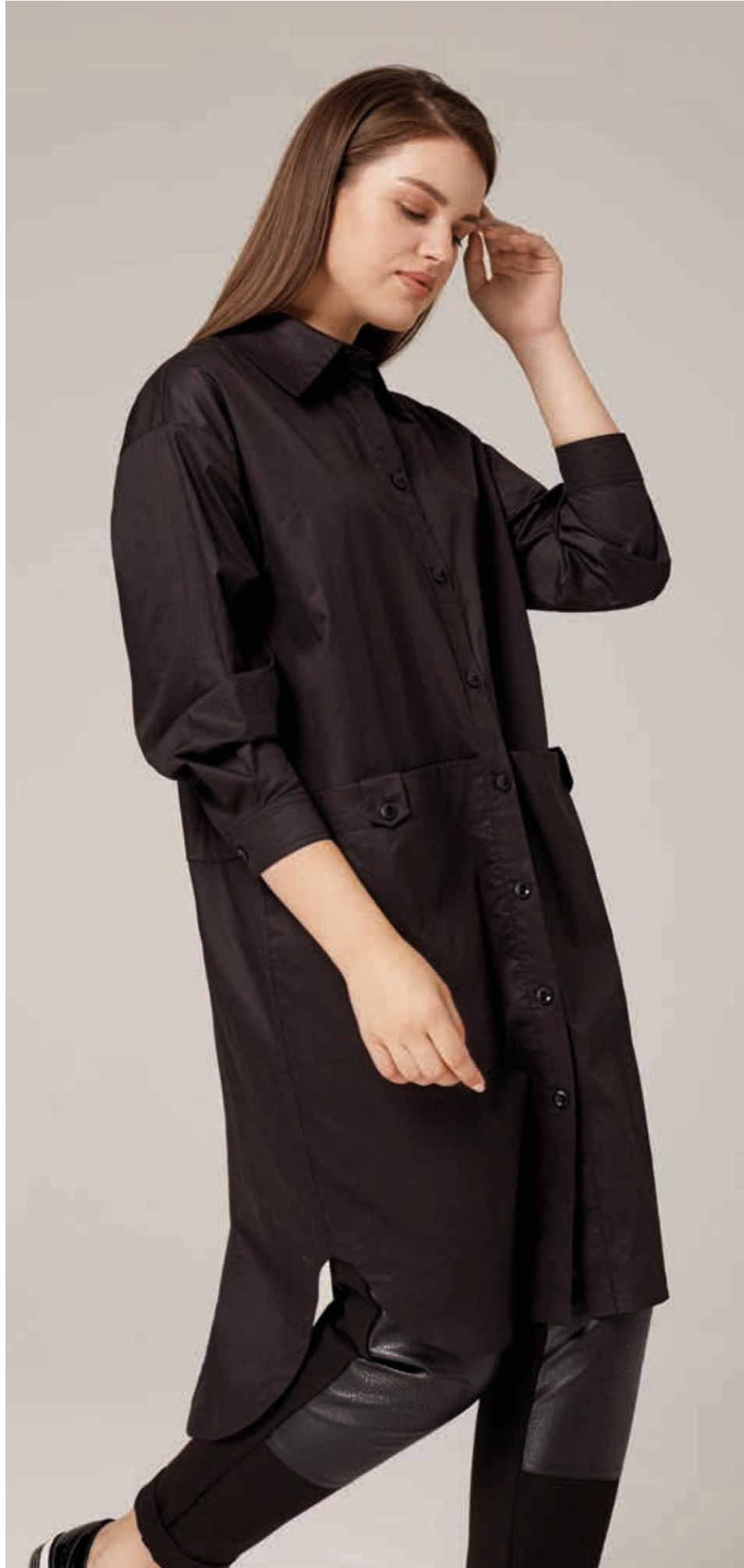
РУБАШКА АРТ. 18-702

СОСТАВ: 100% ХЛОПОК ЦВЕТ: ЧЕРНЫЙ РАЗМЕРНЫЙ РЯД: М, L, XL