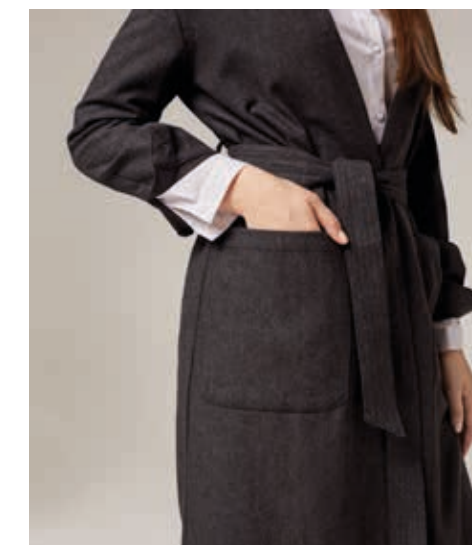
ПАЛЬТО АРТ. 18-011

СОСТАВ: 80% ШЕРСТЬ, 20% ПЭ ЦВЕТ: СЕРЫЙ РАЗМЕРНЫЙ РЯД: M, L, XL, 2XL