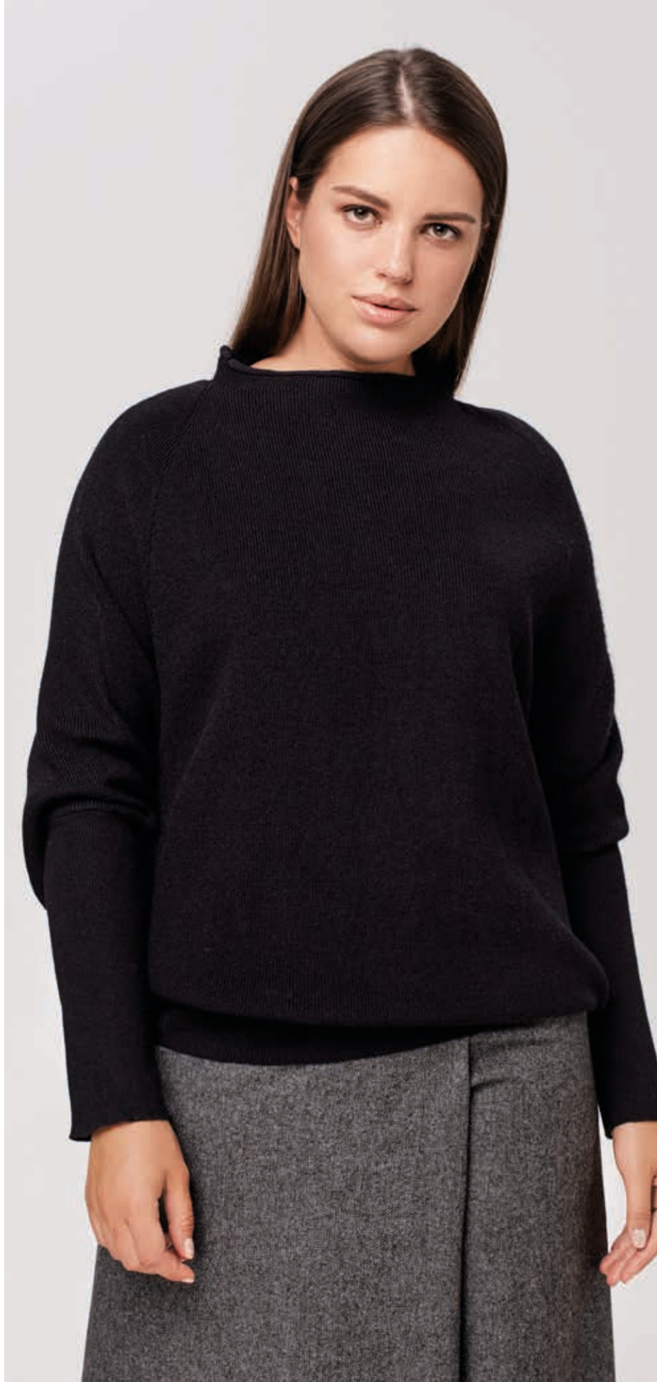
ДЖЕМПЕР АРТ. 89007/1

СОСТАВ: 50% ШЕРСТЬ КРОЛИКА, 23% ХЛОПОК, 27% ВИСКОЗА ЦВЕТ: ЧЕРНЫЙ РАЗМЕРНЫЙ РЯД: М, L, XL