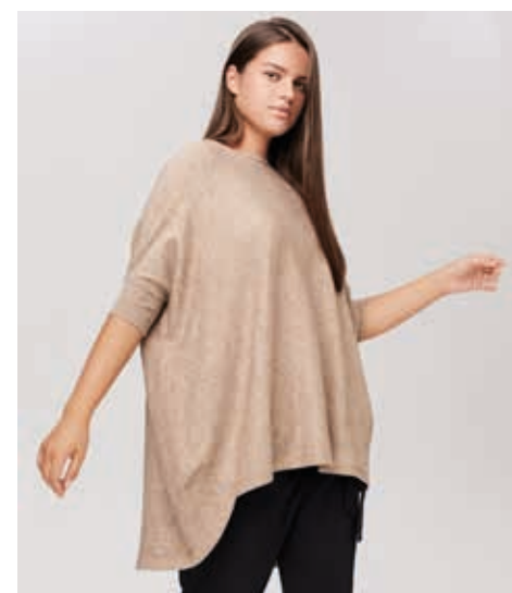
БЛУЗА АРТ. CU 035

СОСТАВ: 50% ШЕРСТЬ КРОЛИКА, 23% ХЛОПОК, 27% ВИСКОЗА ЦВЕТ: СИНИЙ, ЗЕЛЕНый, КОФЕ, БЕЖЕВый РАЗМЕРный РЯД: F