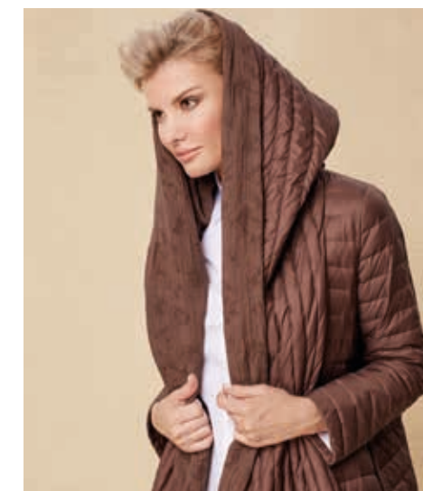
ПАЛЬТО АРТ. 18-954

СОСТАВ: 90% ПУХ, 10% ПЕРО ЦВЕТ: ШОКОЛАД РАЗМЕРНЫЙ РЯД: M, L, XL