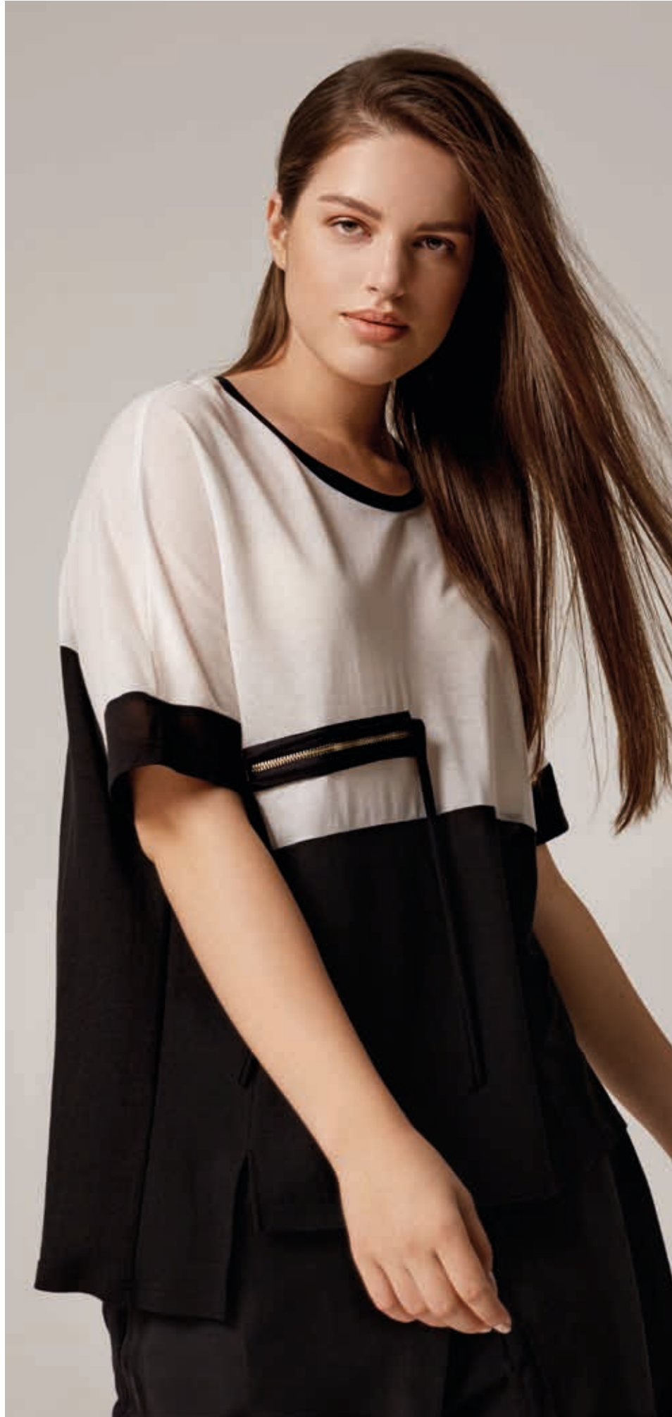
БЛУЗА АРТ. 18-703

СОСТАВ: 36% БАМБУК, 28% ХЛОПОК, 36% ТЕНСЕЛ ЦВЕТ: БЕЛЫЙ, БЕЖЕВЫЙ РАЗМЕРНЫЙ РЯД: М, L, XL