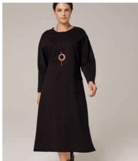
ПЛАТЬЕ АРТ. 18-982

СОСТАВ: 100% ХЛОПОК ЦВЕТ: ХАКИ, БЕЖЕВЫЙ, ЧЕРНЫЙ РАЗМЕРНЫЙ РЯД: М, L, XL