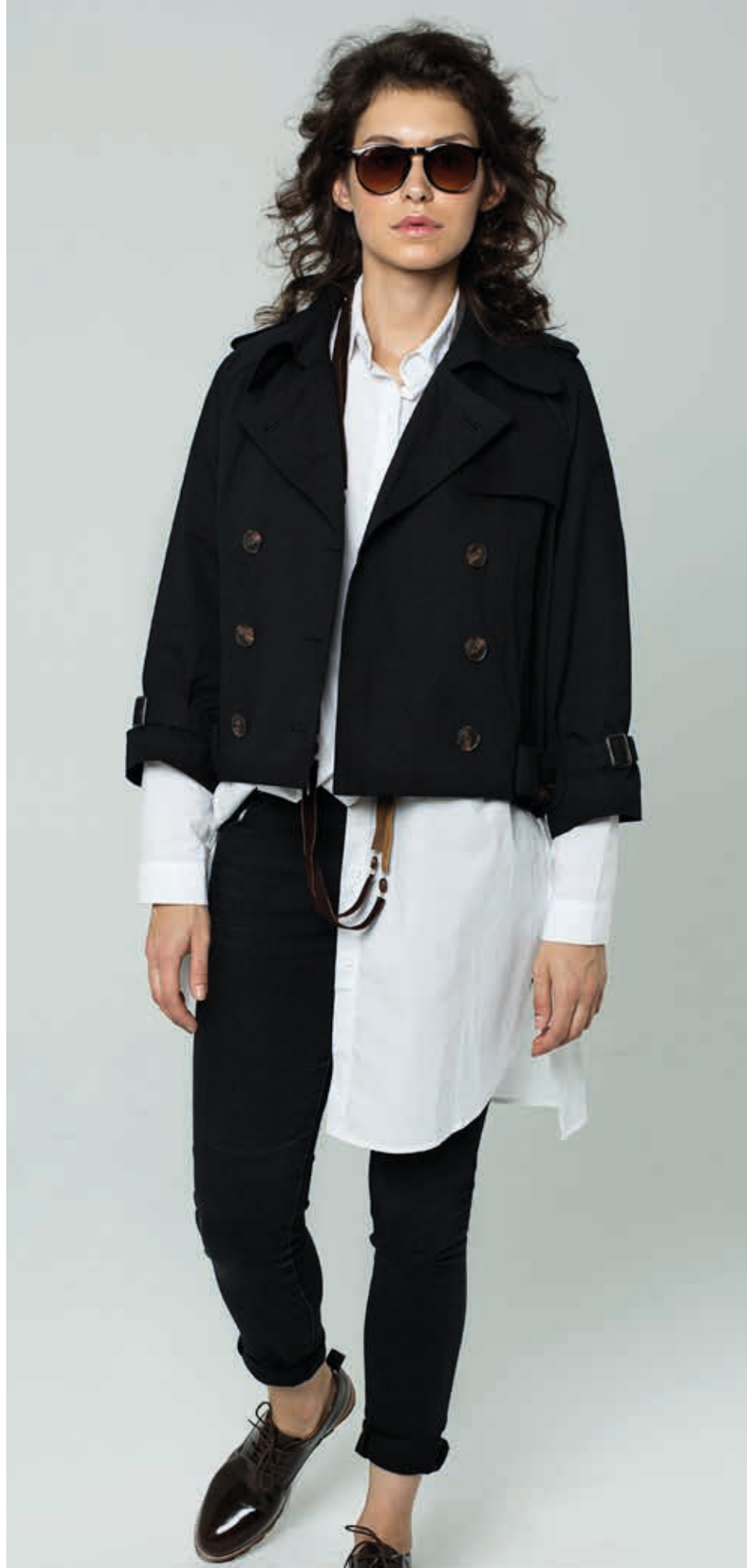
ЖАКЕТ АРТ. 17-412

СОСТАВ: 100% ХЛОПОК ЦВЕТ: ЧЕРНЫЙ РАЗМЕРНЫЙ РЯД: М, L, XL