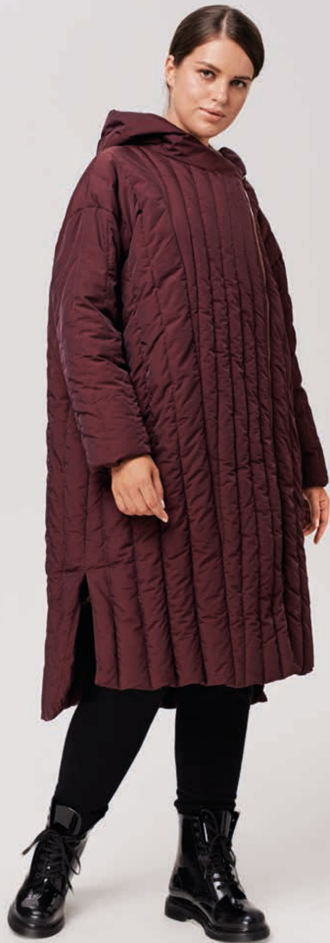
ПАЛЬТО АРТ. 18-949

СОСТАВ: 90% ПУХ, 10% ПЕРО ЦВЕТ: БОРДОВЫЙ РАЗМЕРНЫЙ РЯД: М, L, XL