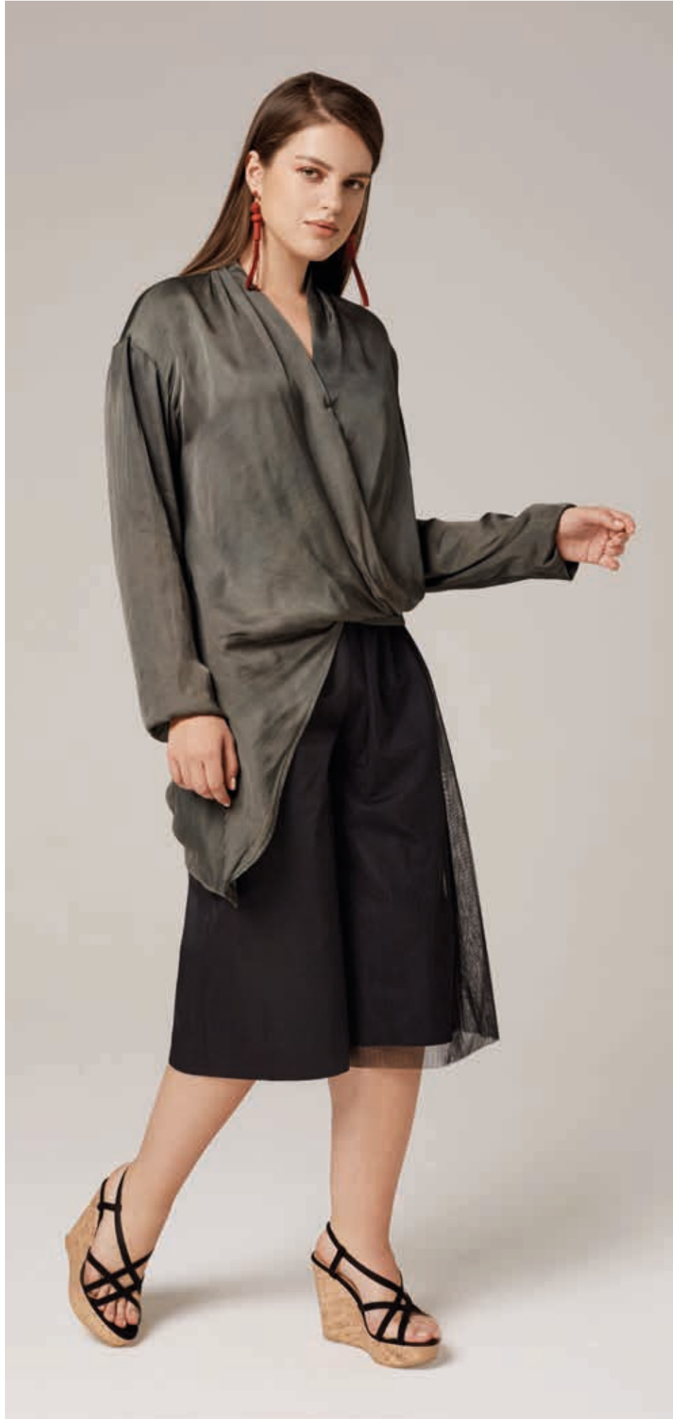
БЛУЗА АРТ. 18-725 Д

СОСТАВ: 100% ШЕЛК ЦВЕТ: ХАКИ, ЧЕРНЫЙ РАЗМЕРНЫЙ РЯД: М, L, XL, 2XL