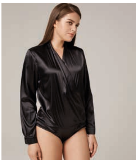
БЛУЗА БОДИ АРТ. 18-975

СОСТАВ: 100% ШЕЛК ЦВЕТ: БЕЛЫЙ, ЧЕРНЫЙ РАЗМЕРНЫЙ РЯД: S, M, L