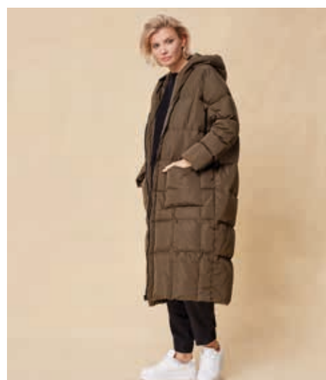
ПАЛЬТО АРТ. 19-009

СОСТАВ: 90% ПУХ, 10% ПЕРО ЦВЕТ: ХАКИ РАЗМЕРНЫЙ РЯД: F oversize