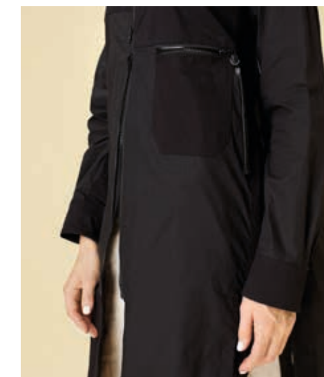
ПЛАЩ АРТ. 18-015

СОСТАВ: 100% ХЛОПОК ЦВЕТ: ЧЕРНЫЙ РАЗМЕРНЫЙ РЯД: М, L, XL, 2XL