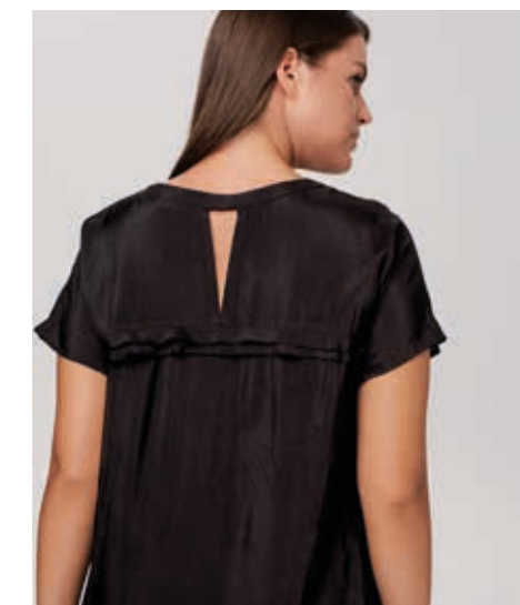
ПЛАТЬЕ АРТ. 18-726

СОСТАВ: 70% ХЛОПОК, 30% ШЕЛК ЦВЕТ: ЧЕРНЫЙ, БЕЖЕВЫЙ РАЗМЕРНЫЙ РЯД: М, L, XL