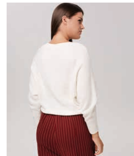
ДЖЕМПЕР АРТ. 89017

СОСТАВ: 20% ЛЕН, 10% КОНОПЛЯ, 10% ШЕРСТЬ, 30% АКРИЛ, 30% ВИСКОЗА ЦВЕТ: БЕЛЫЙ, СИНИЙ РАЗМЕРНЫЙ РЯД: М, L, XL