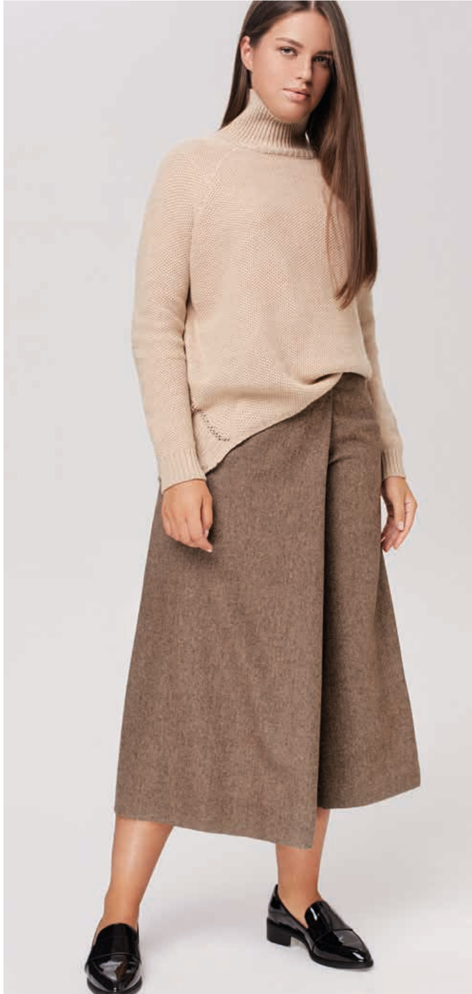
ОСЕНЬ-ЗИМА 2016 ДЖЕМПЕР АРТ. 18-979

СОСТАВ: 50% АНГОРА, 23% ХЛОПОК, 27% ВИСКОЗА ЦВЕТ: БЕЖЕВЫЙ, СЕРЫЙ РАЗМЕРНЫЙ РЯД: М, L, XL