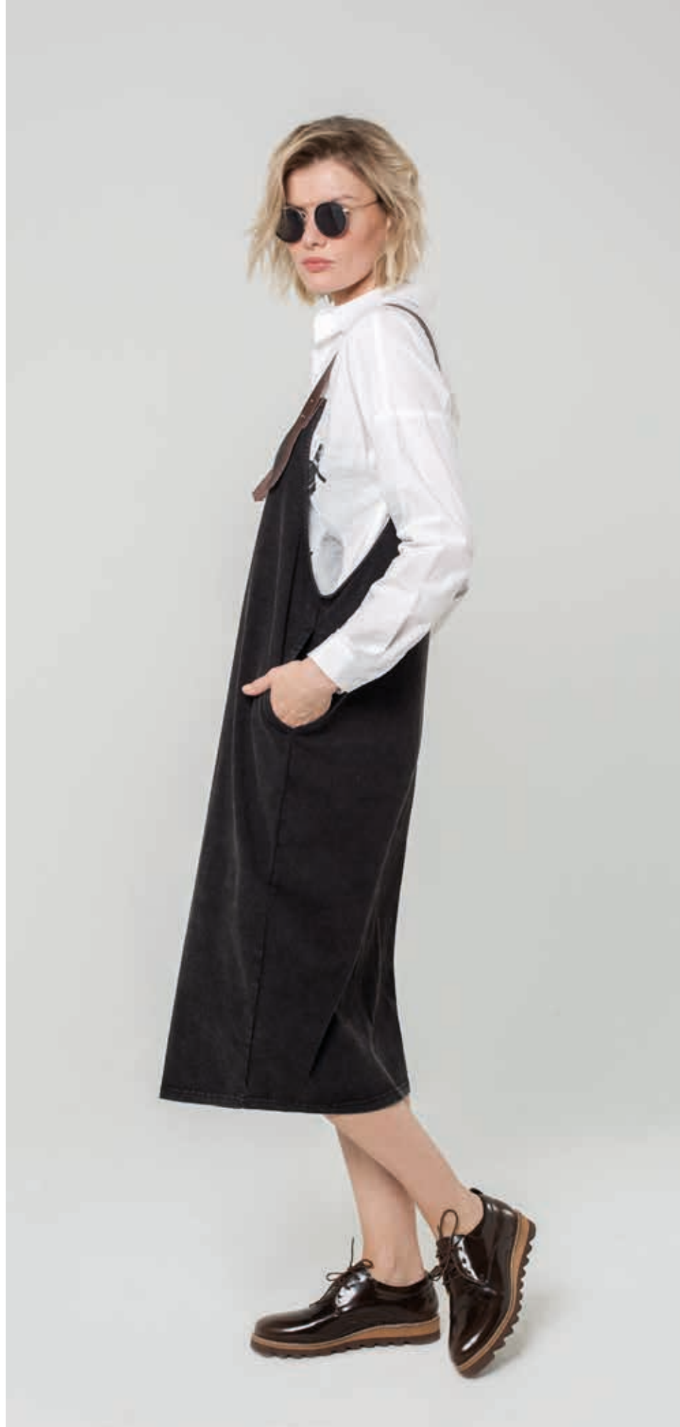
САРАФАН АРТ. 17-312 Т

СОСТАВ: 100% ХЛОПОК ЦВЕТ: ЧЕРНЫЙ РАЗМЕРНЫЙ РЯД: М, L, XL, 2XL