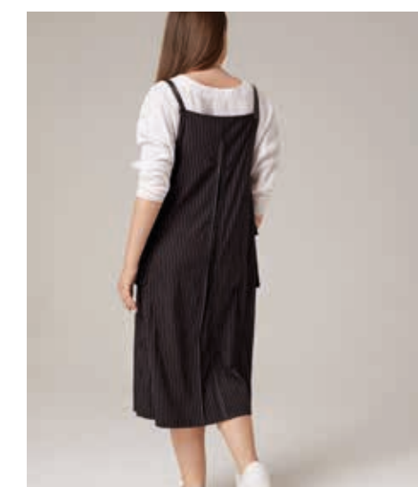
САРАФАН АРТ. 18-985

СОСТАВ: 30% ХЛОПОК, 56% ТЕНСЕЛ, 14% ПОЛИЭСТЕР ЦВЕТ: ПОЛОСА РАЗМЕРНЫЙ РЯД: М, L, XL, 2XL