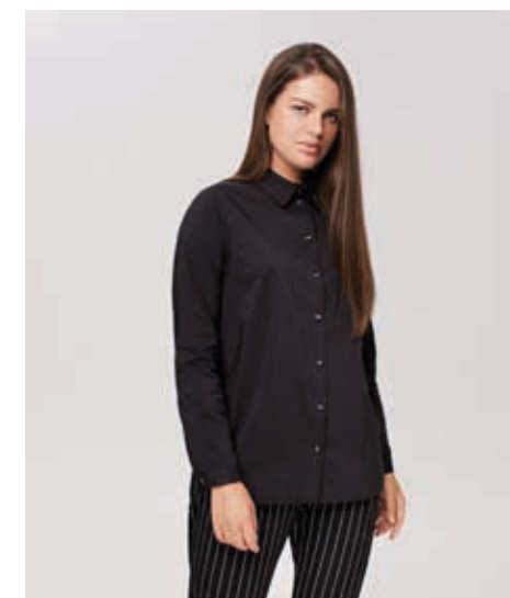
БЛУЗА АРТ. 17-572

СОСТАВ: 100% ХЛОПОК ЦВЕТ: ЧЕРНЫЙ, БЕЛЫЙ РАЗМЕРНЫЙ РЯД: M, L, XL, 2XL