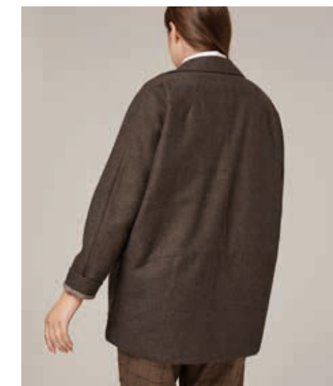
ЖАКЕТ АРТ. 18-971

СОСТАВ: А: 50% ШЕРСТЬ, 30% РАЙОН, 20% ПЭ Б: 100% ХЛОПОК ЦВЕТ: ЗЕЛЕНый РАЗМЕРНЫЙ РЯД: М, L, XL