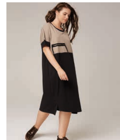
ТУНИКА АРТ. 18-716

СОСТАВ: 36% ТЕНСЕЛ, 50% ХЛОПОК, 10% БАМБУК, 4% СПАНДЕКС ЦВЕТ: БЕЖЕВЫЙ, БОРДОВЫЙ РАЗМЕРНЫЙ РЯД: М, L, XL, 2XL