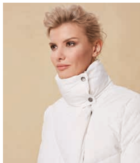
ПАЛЬТО АРТ. 18-951

СОСТАВ: 90% ПУХ, 10% ПЕРО ЦВЕТ: БЕЛЫЙ, ЧЕРНЫЙ РАЗМЕРНЫЙ РЯД: М, L, XL, 2XL