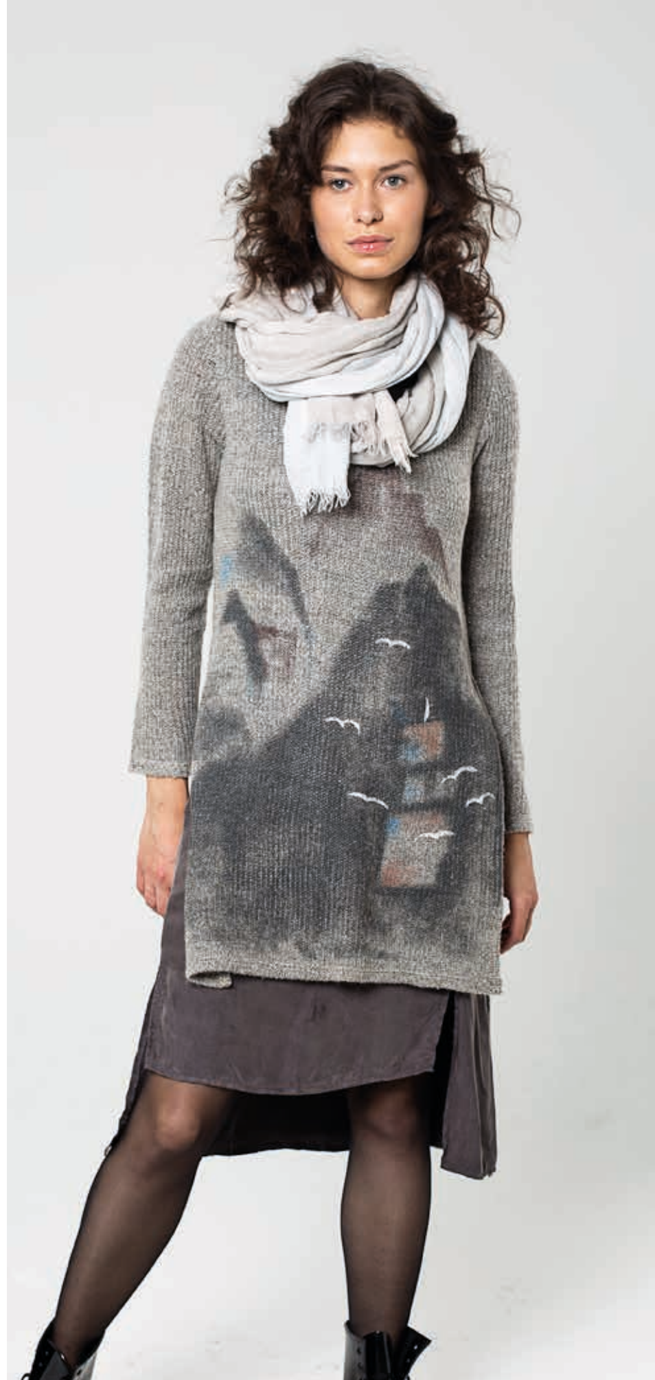
ТУНИКА АРТ. CU 028

СОСТАВ: 30% КАШЕМИР, 5% МАХЕР, 65% ПЭФ ЦВЕТ: СЕРЫЙ ПРИНТ РАЗМЕРНЫЙ РЯД: М, L, XL