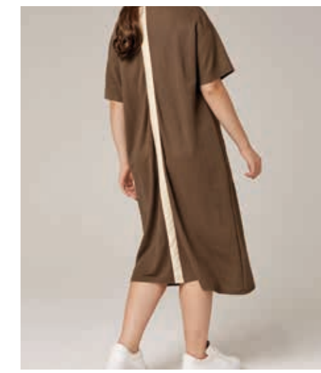
ПЛАТЬЕ АРТ. 18-706

СОСТАВ: 36% КРАПИВА, 60% ТЕНСЕЛ, 4% МОДАЛ ЦВЕТ: ЧЕРНЫЙ, СЕРЫЙ, ХАКИ РАЗМЕРНЫЙ РЯД: М, L, XL, 2XL