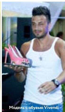
Модель с обувью Vivendi