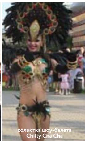
солистка шоу-балета Chilly Cha Cha