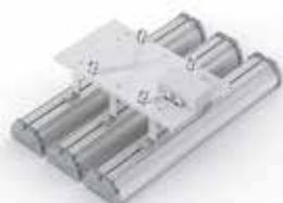
V4-10-70.0004.IRO-0001 Подвесное крепление для 3 шт. светильников 325×120×300mm