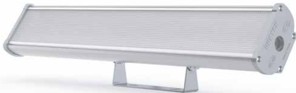
V4-10-70.0087.IRO-0001 Поворотное крепление (угол 180°) для светильников Iron 192×45×80mm

Крепления для светодиодных светильников серии Iron, Iron 2.0 и Iron Lens.