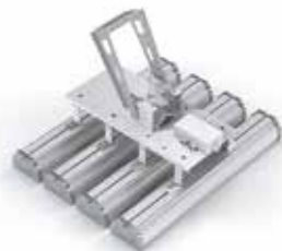
V4-10-70.0002.IRO-0003 Поворотное крепление для 4 шт. светильников 450×276×300mm