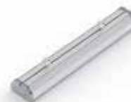
V4-10-70.0003.IRO-0004 Подвесное крепление на рым-гайках, комплект из двух штук