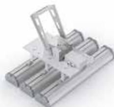
V4-10-70.0002.IRO-0002 Поворотное крепление для 3 шт. светильников 325×276×300mm