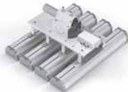
V4-10-70.0003.IRO-0002 Консоль для 4 шт. светильников 450×120×300mm