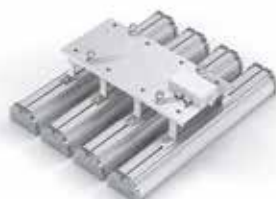
V4-10-70.0003.IRO-0003 Подвесное крепление для 4 шт. светильников 450×120×300mm