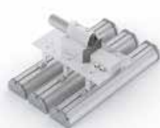
V4-10-70.0003.IRO-0001 Консоль для 3 шт. светильников 325×120×300mm