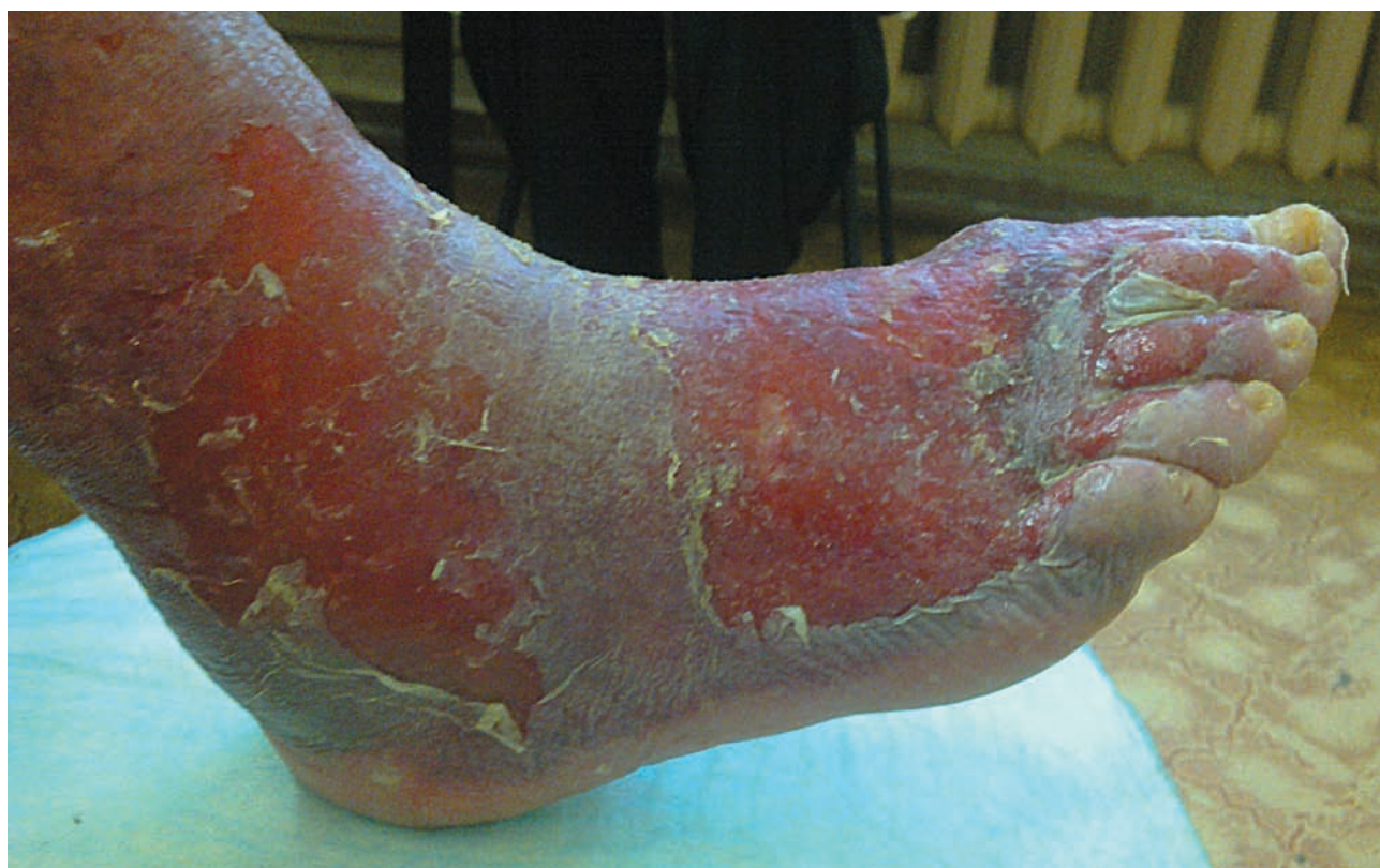
Рис. 7. Дерматит простой термический (кипяток)