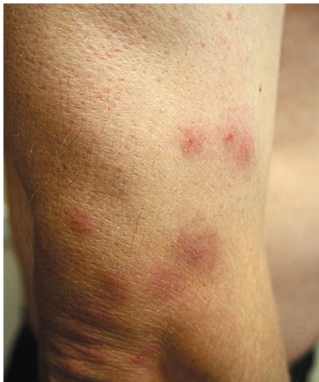
Рис. 8. Дерматит простой. Флеботодермия (укусы клопов)