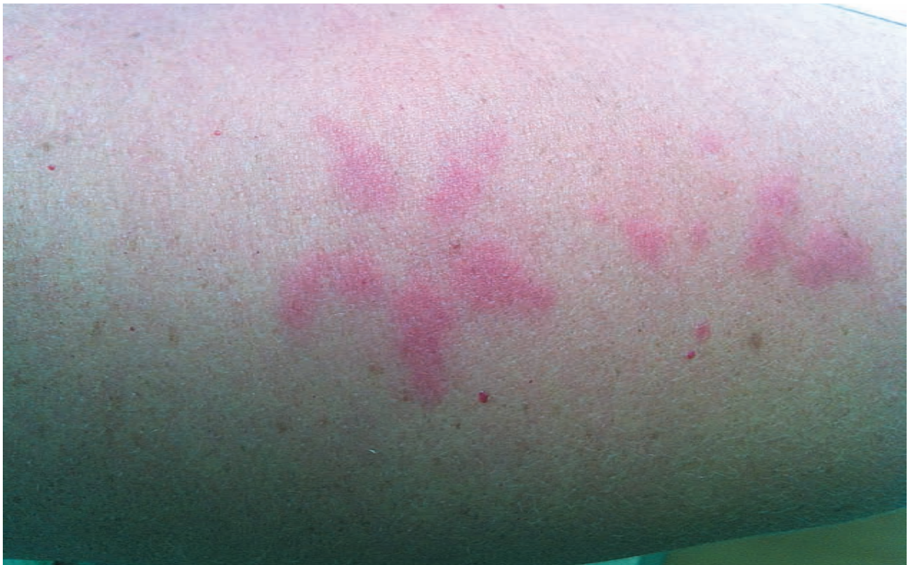
Рис. 4. Дерматит аллергический контактный