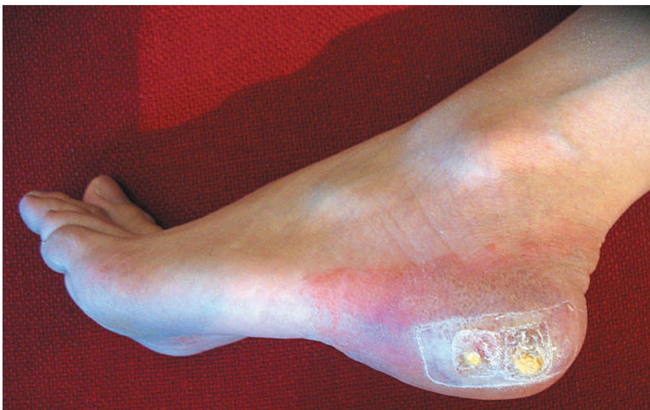
Рис. 2. Дерматит аллергический (применение салিপода)