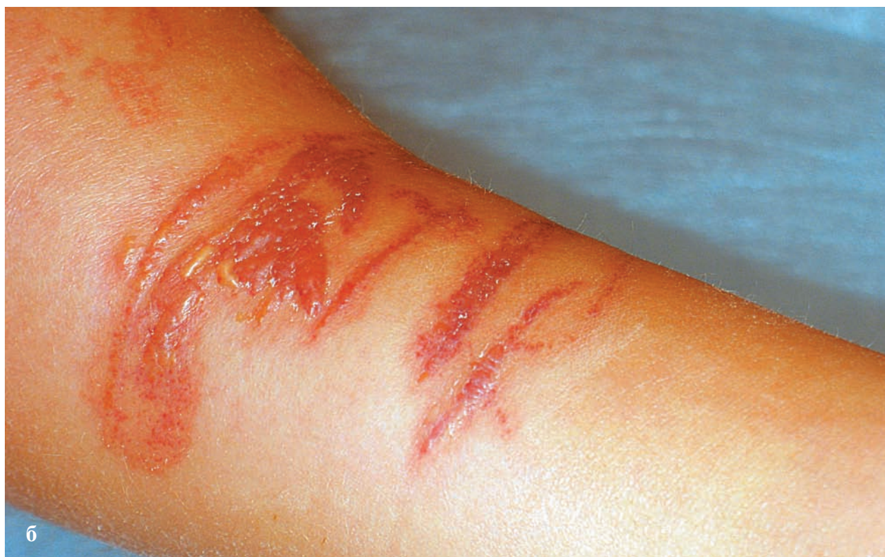
Рис. 5. Дерматит купальщиков (контакт с медузой) (а, б)