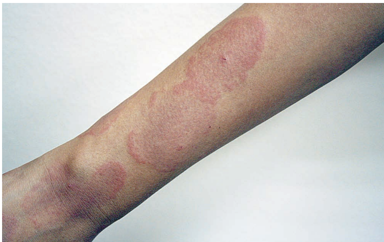
Рис. 9. Дерматит простой. Флеботодермия (укусы пчел)