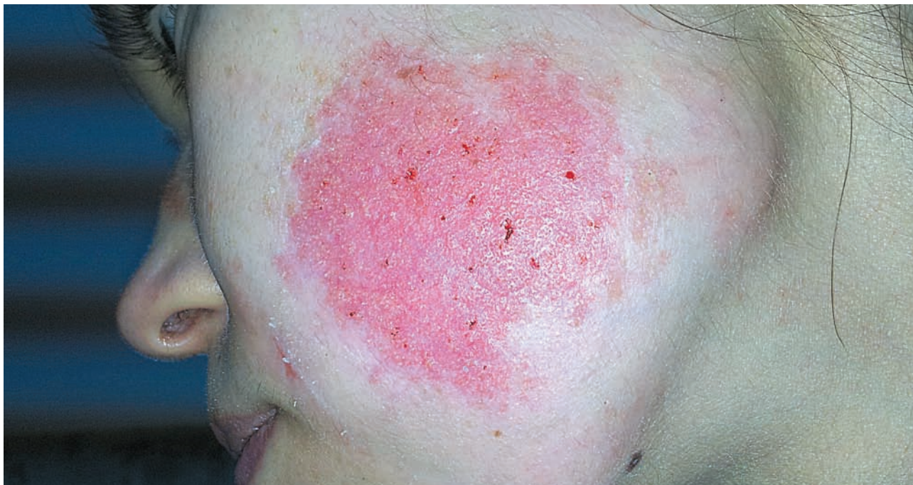
Рис. 1. Дерматит аллергический медикаментозный