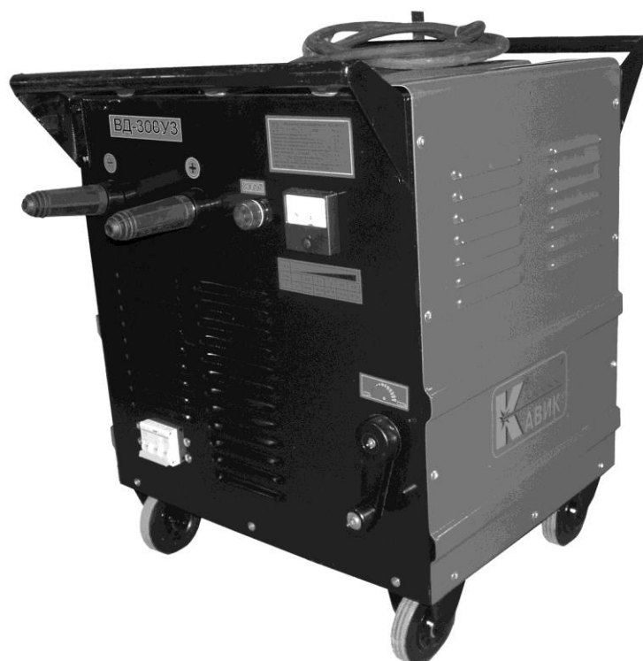
Рис 1. Общий вид выпрямителя

1.9. Охлаждение- воздушно-принудительное.