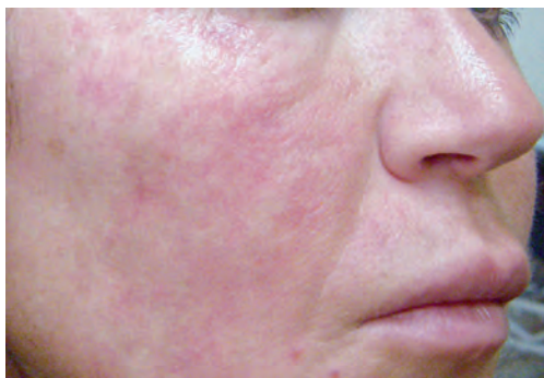
Рис. 1.2 Неоднородный цвет кожи с белесыми участками и телеангиэктазиями.