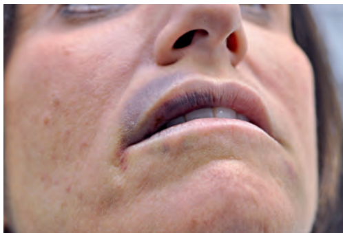
Рис. 2.2 Экхимозы верхней губы после инъекции наполнителей на основе гиалуроновой кислоты.

Перфорации сосудов иглой можно избежать, точно зная анатомию поверхности лица и старательно воздерживаясь от повреждения видимых сосудов дермы среднего калибра. Боковое освещение и очистка лица смоченными в спирте тампонами помогают высветить голубоватые сосуды дермы. Труднее предупредить экхимозы вследствие компрессии сосудов наполнителями, особенно если вводится большое количество материала высокой вязкости. Один из методов предусматривает образование канала в поверхностном слое подкожной жировой клетчатки посредством длинной