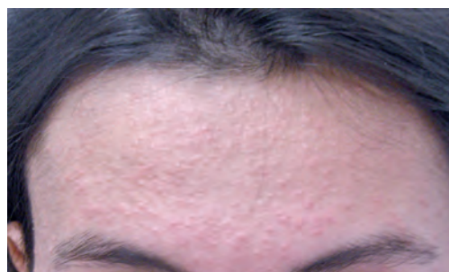
Рис. 1.5 Акнеформные высыпания после пилинга ПВК.