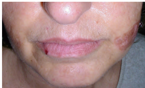
Рис. 1.4 Легкая инфекция вируса простого герпеса на губах после пилинга ТХК по поводу лентиго.