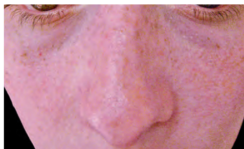
Рис. 1.6 Милиумы.