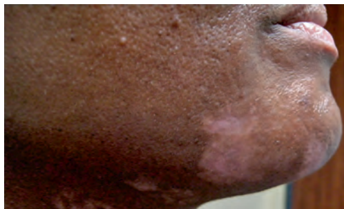
Рис. 1.7 Пятна гипопигментации после пилинга 70% раствором гликолевой кислоты у пациентки с темным цветом кожи.