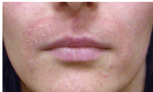
Рис. 1.3 Контактный дерматит после применения увлажняющего препарата в период после пилинга.