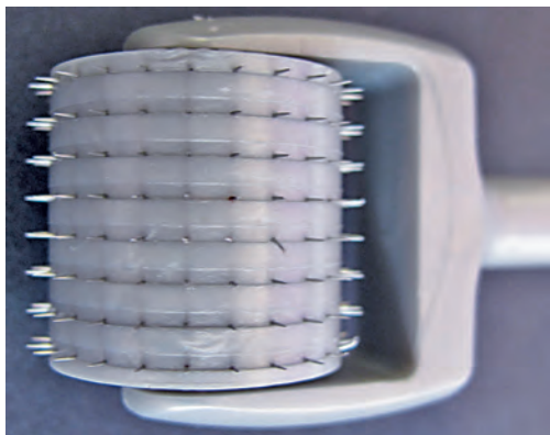
Рис. 13.9 Некоторые кончики игл изогнулись в форме рыболовного крючка. Применение такого инструмента может привести к длительно не заживающим гематомам.

ванию. Однако при применении медицинского роллера рубцевания не происходит.