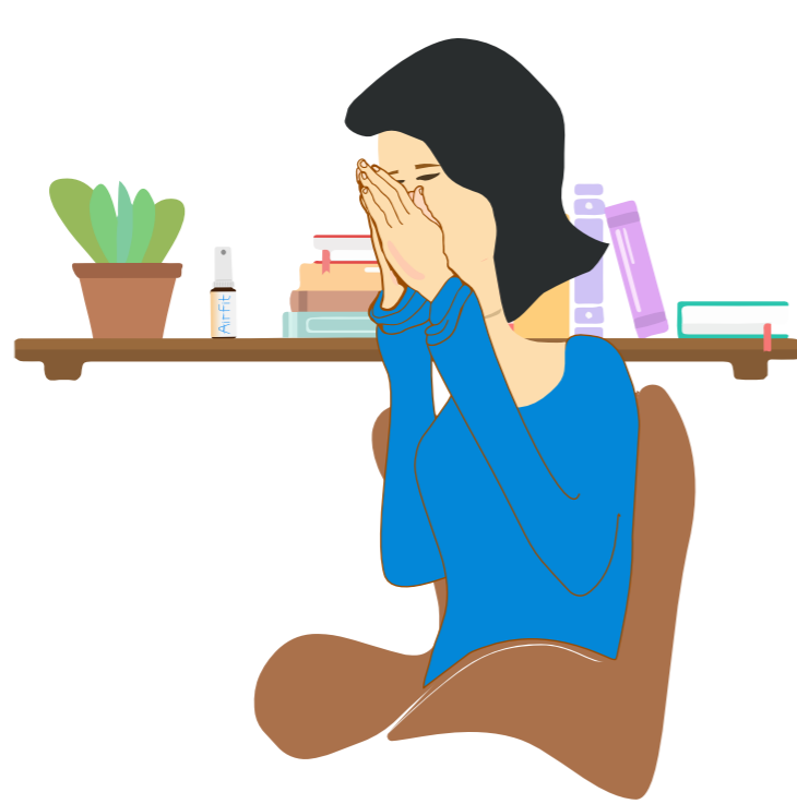
Способ применения «ЛАДОШКИ»