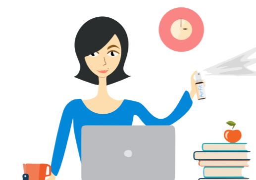
Распыление на работе