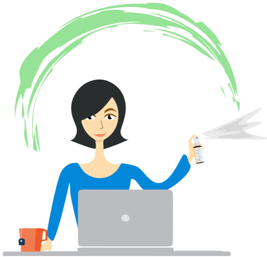
Распыление вокруг себя