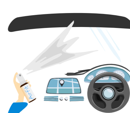
Аэрация в автомобиле